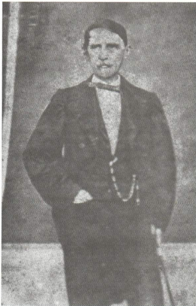
Juan Pablo Duarte y Díez (1873).